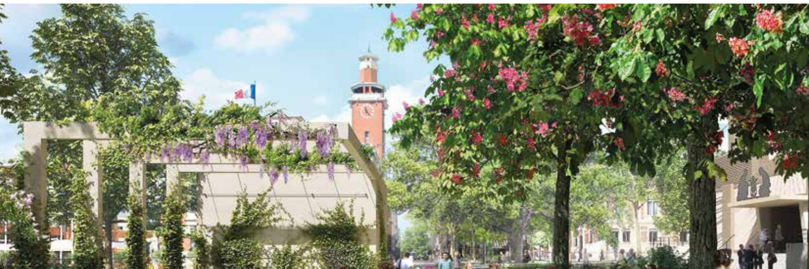
Étienne Lengereau Maire de Montrouge