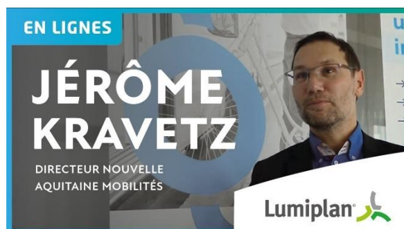
Région Nouvelle-Aquitaine Vidéo 3'30