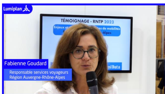
Région Auvergne-Rhône-Alpes Vidéo 3'30