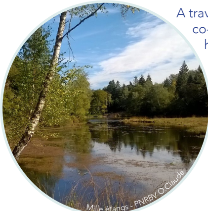
Mille étangs - PNRBV O. Claude

A travers cette campagne, ce parcours valorise la co-évolution de la biodiversité et des activités humaines sur le territoire au fil des époques et les enjeux à venir. Ce sera l'occasion d'aborder la gestion de l'eau au regard des usages, des espèces et des milieux qui en dépendent avec une présentation d'actions en faveur de la gestion durable des étangs et celle des bassins versants (MAEC...). Rencontre avec un territoire où l'ordinaire devient extra.