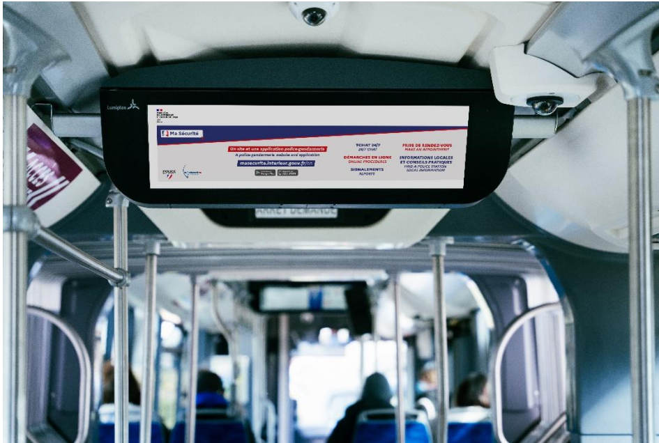
Mockup / Ecran à bord d'un bus communiquant sur Ma Sécurité