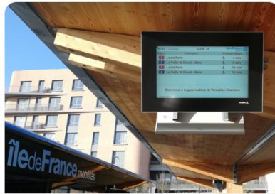
Bornes d'info voyageurs 50% des BIV en France