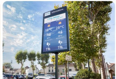
Panneaux d'info citoyenne 50% des panneaux en France

Ma sécurité : www.masecurite.interieur.gouv.fr/fr