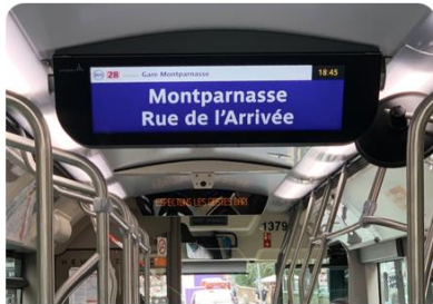
Ecrans d'info voyageurs 50% des écrans en France