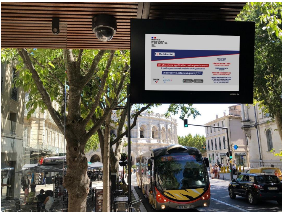
Mockup / Borne d'Information Voyageurs communiquant sur Ma Sécurité à un arrêt de bus