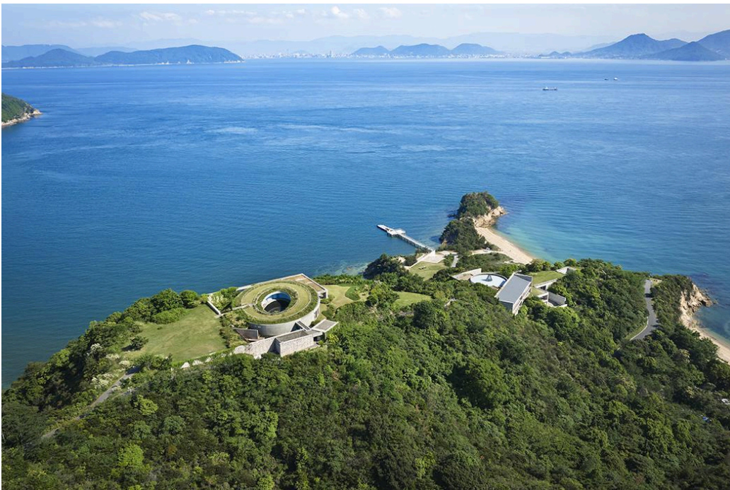
Benesse Art Site Naoshima