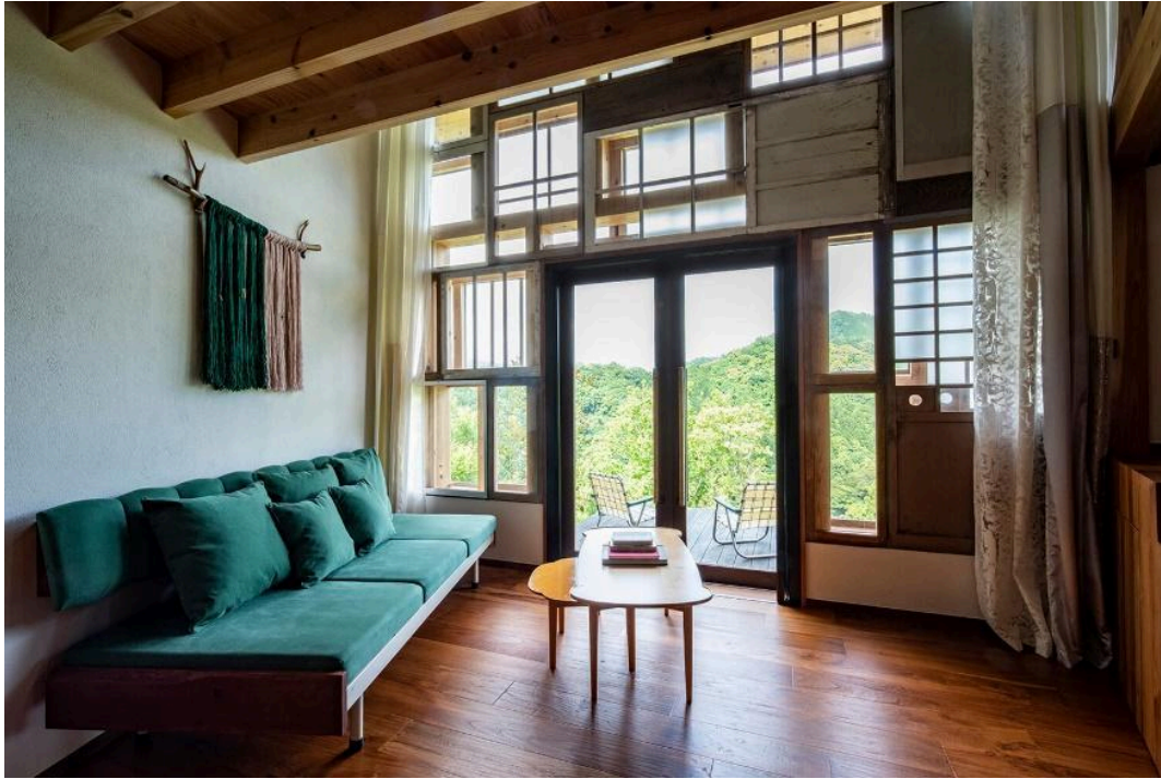
Zero Waste Action Hotel "HOTEL WHY"