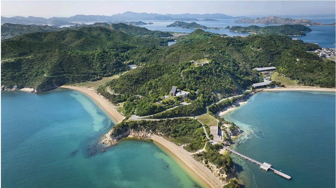
Benesse Art Site Naoshima